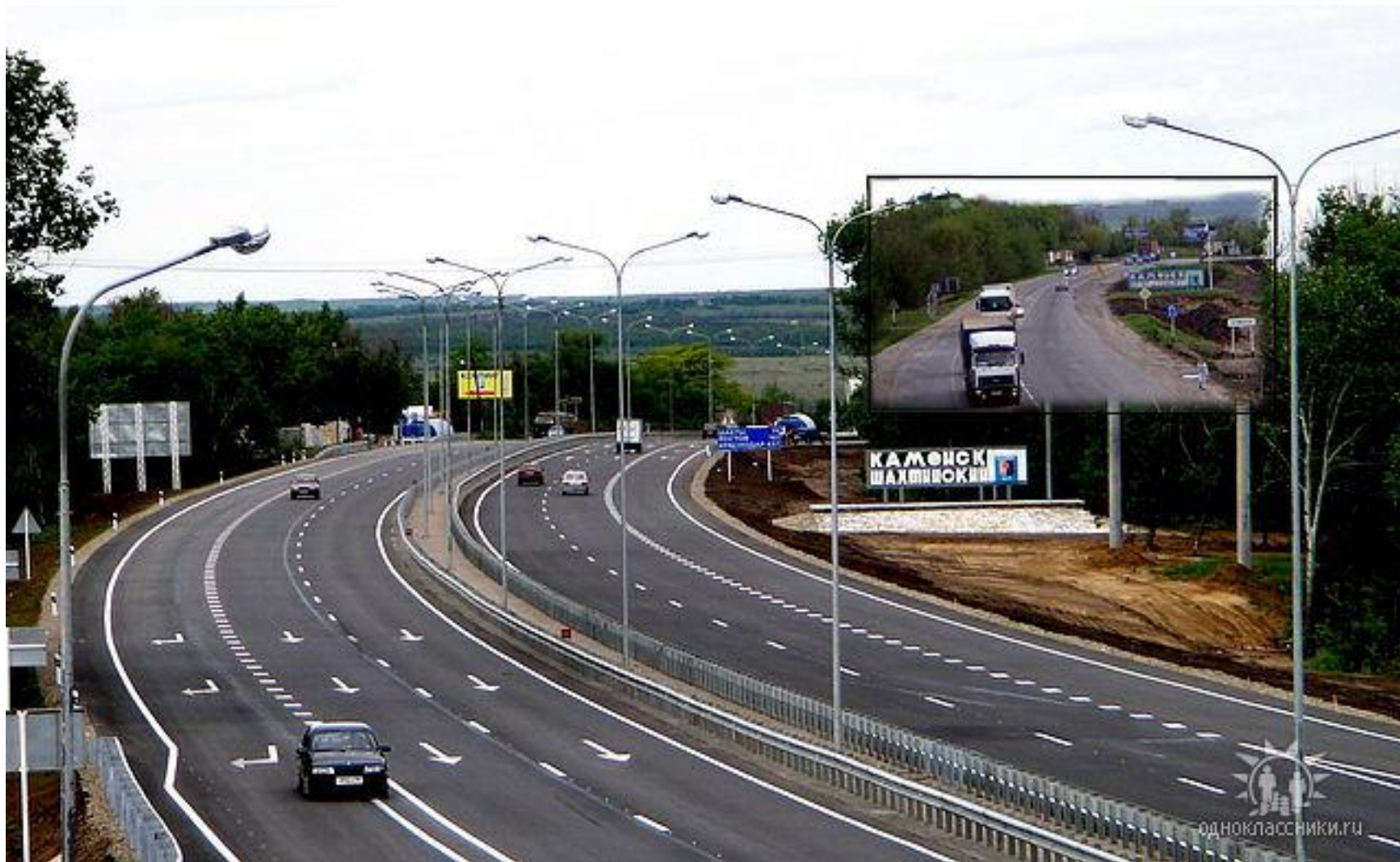
М-4 «ДОН» км 931