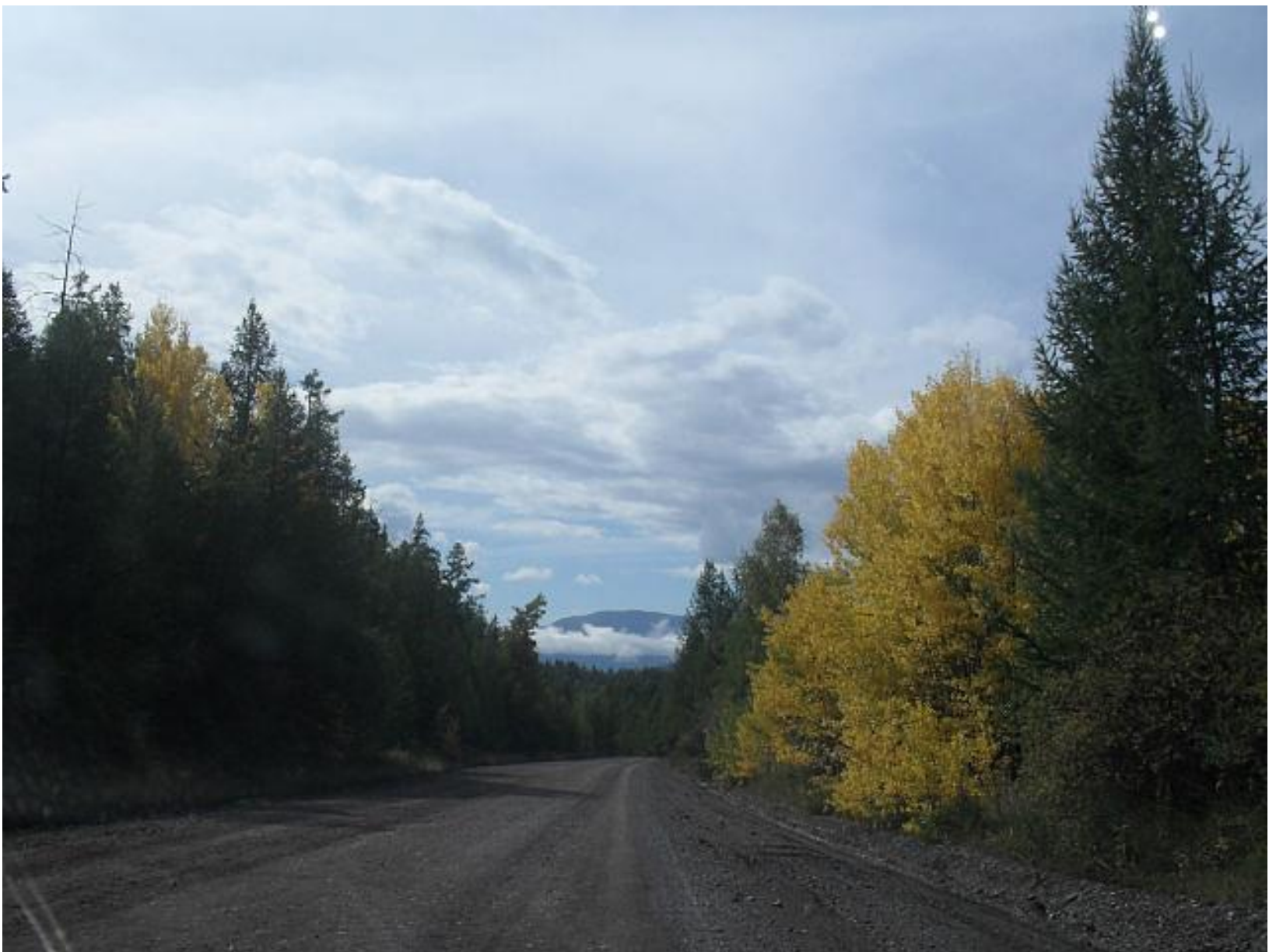
Грунтовка, Западные Саяны