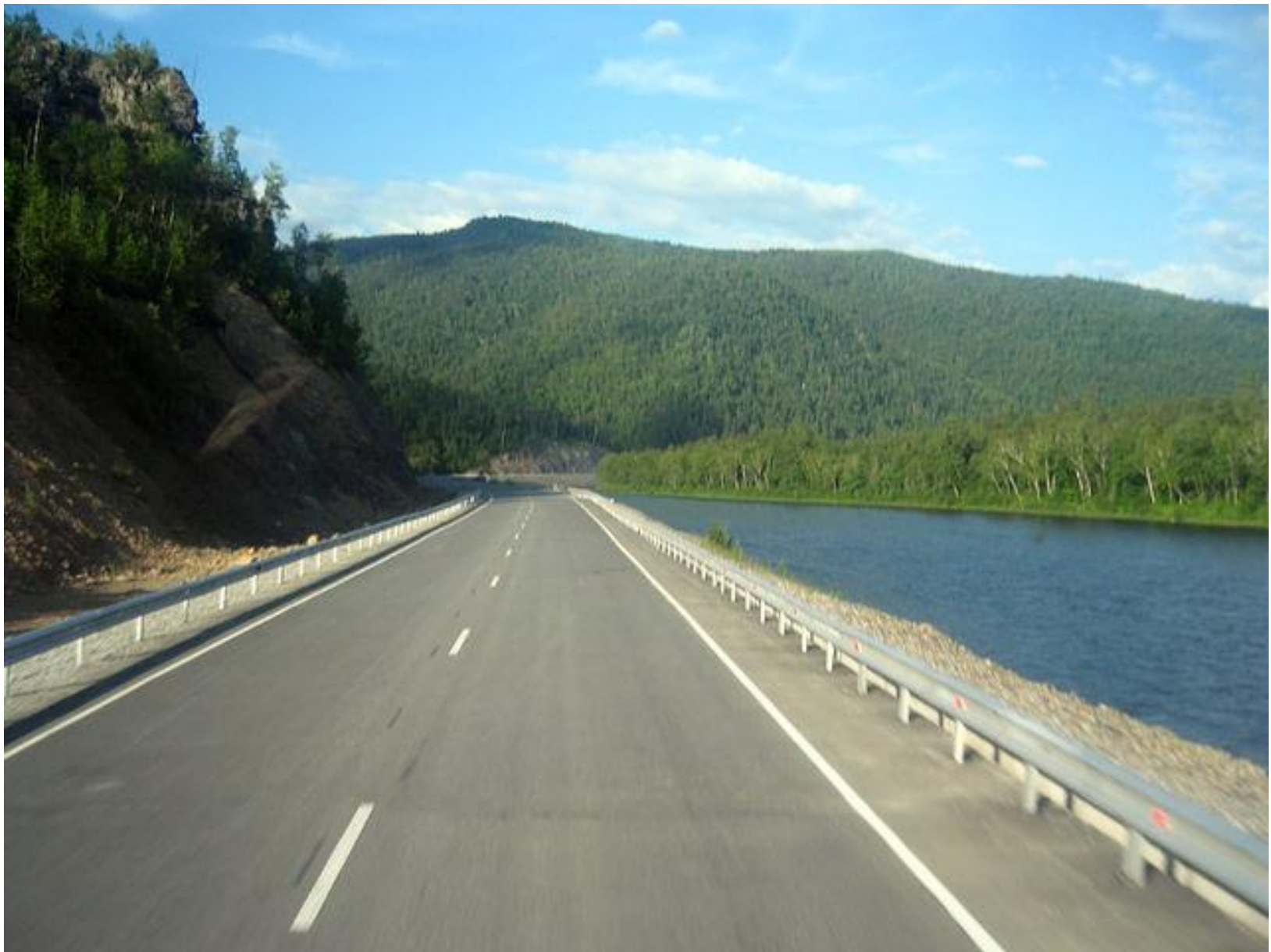
Хабаровск – Сов. Гавань