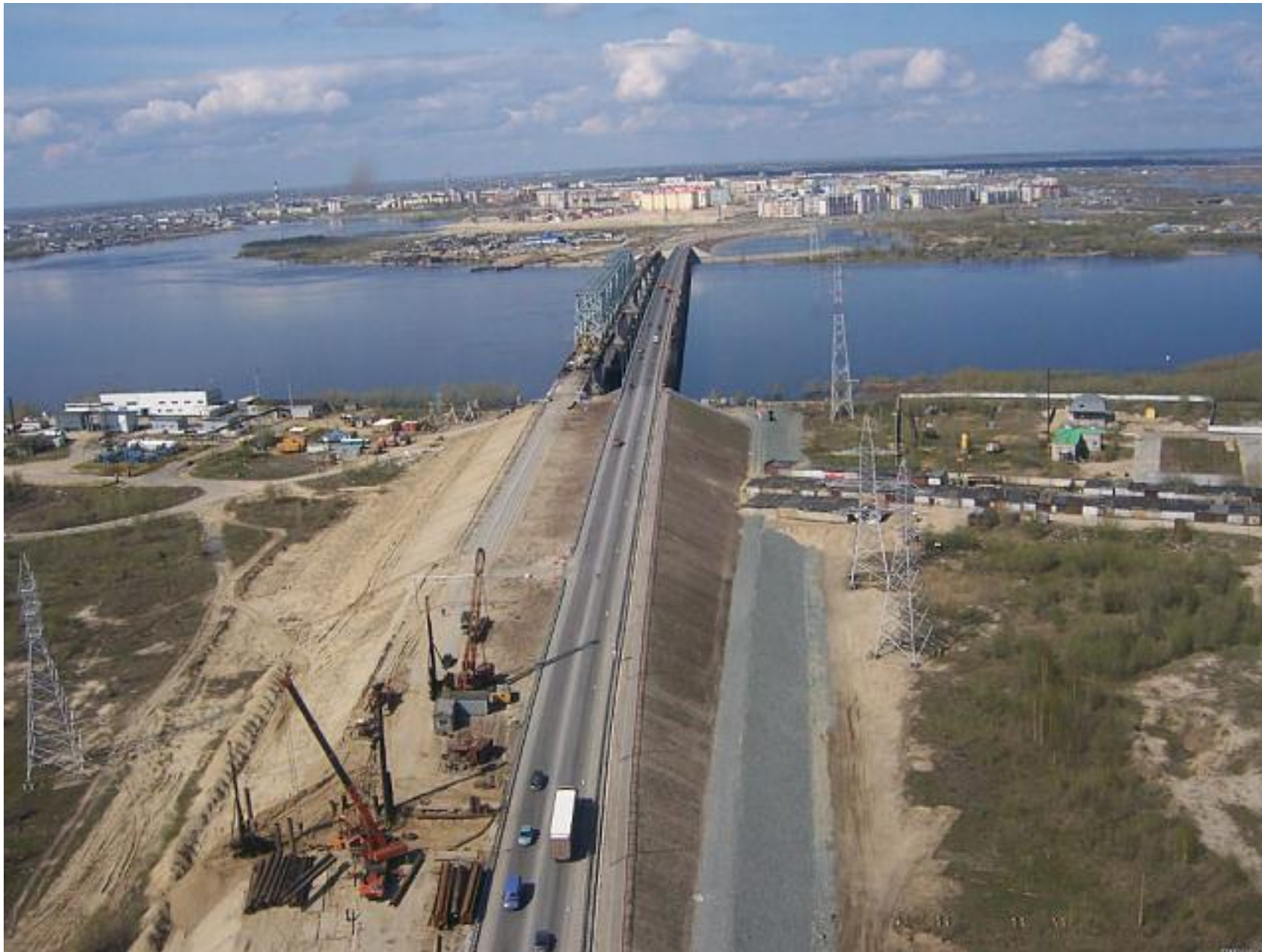
Югра ХМАО .Мост через Юганскую Обь