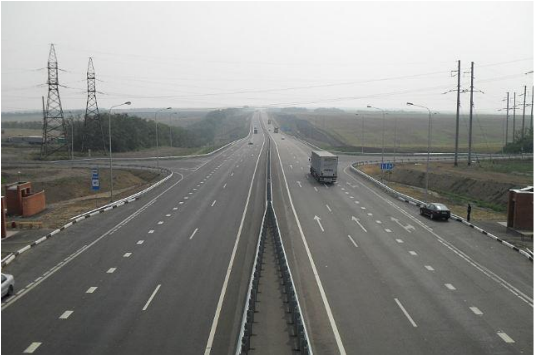
М-4 «Дон» уч.777-801км