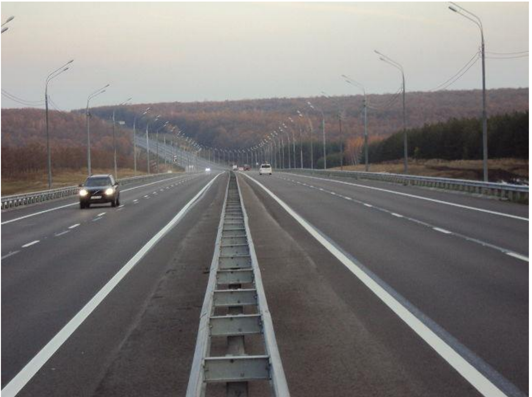
М-4 «Дон» км 450