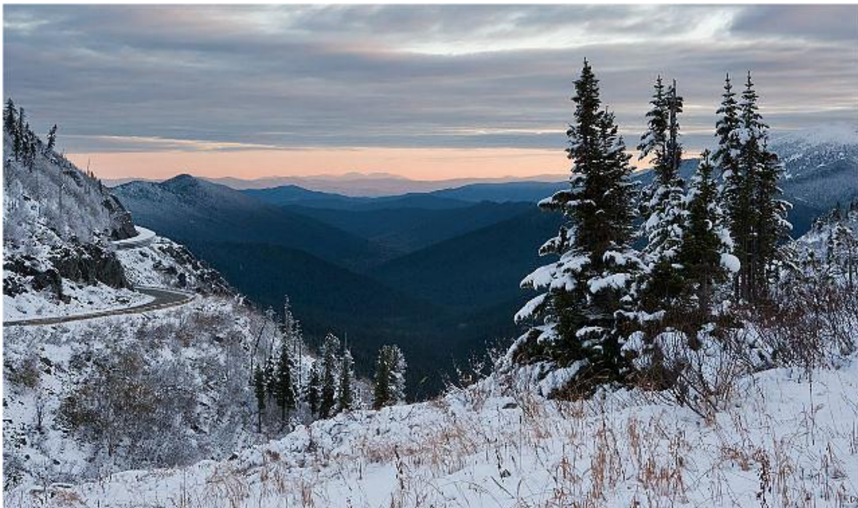
М-54, Большекебежский обход – без противолавинной галереи