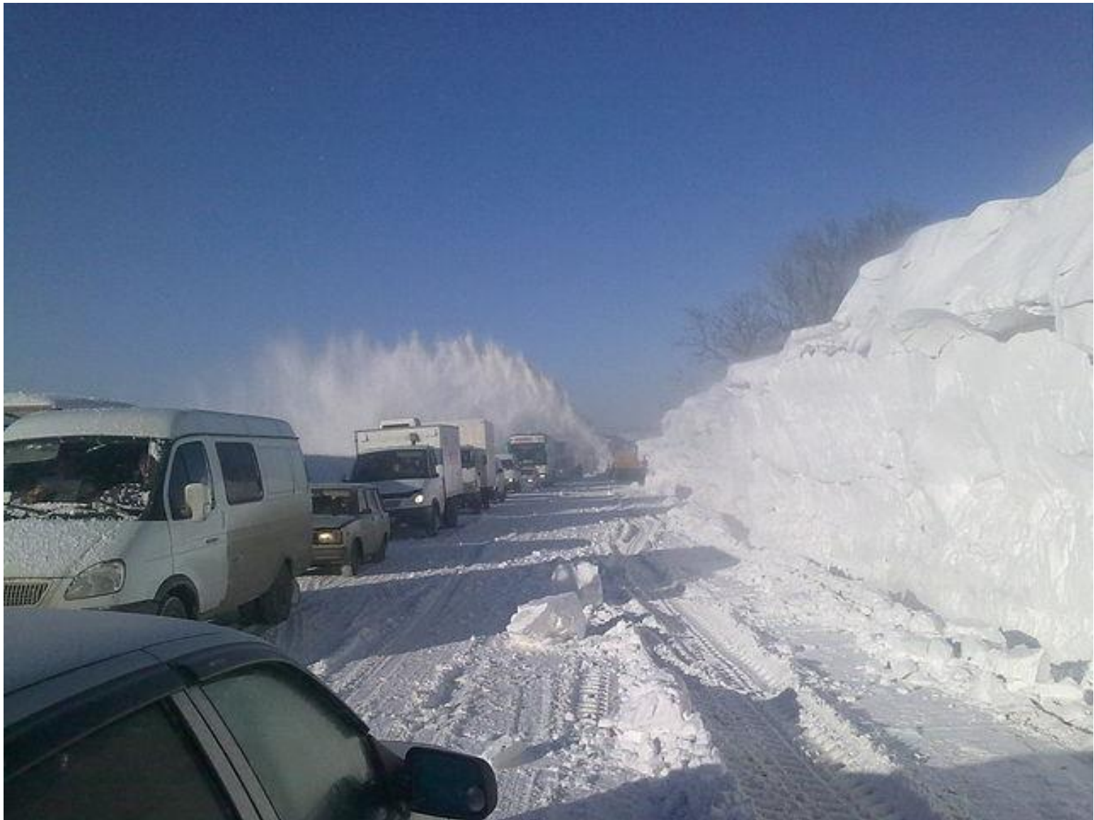
Зимнее содержание на северах