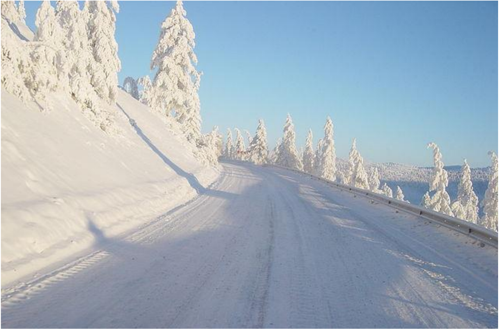
Она же, «Колыма» Якутск - Магадан