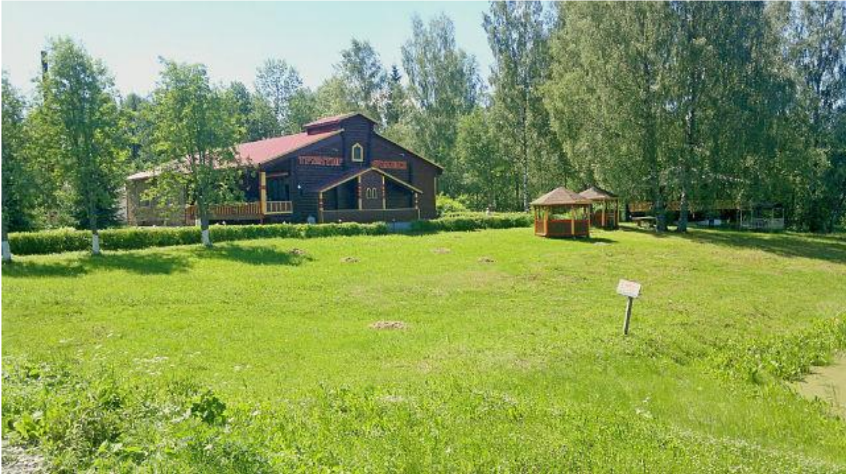
М-10 «Россия» Москва-Санкт-Петербург, км.473