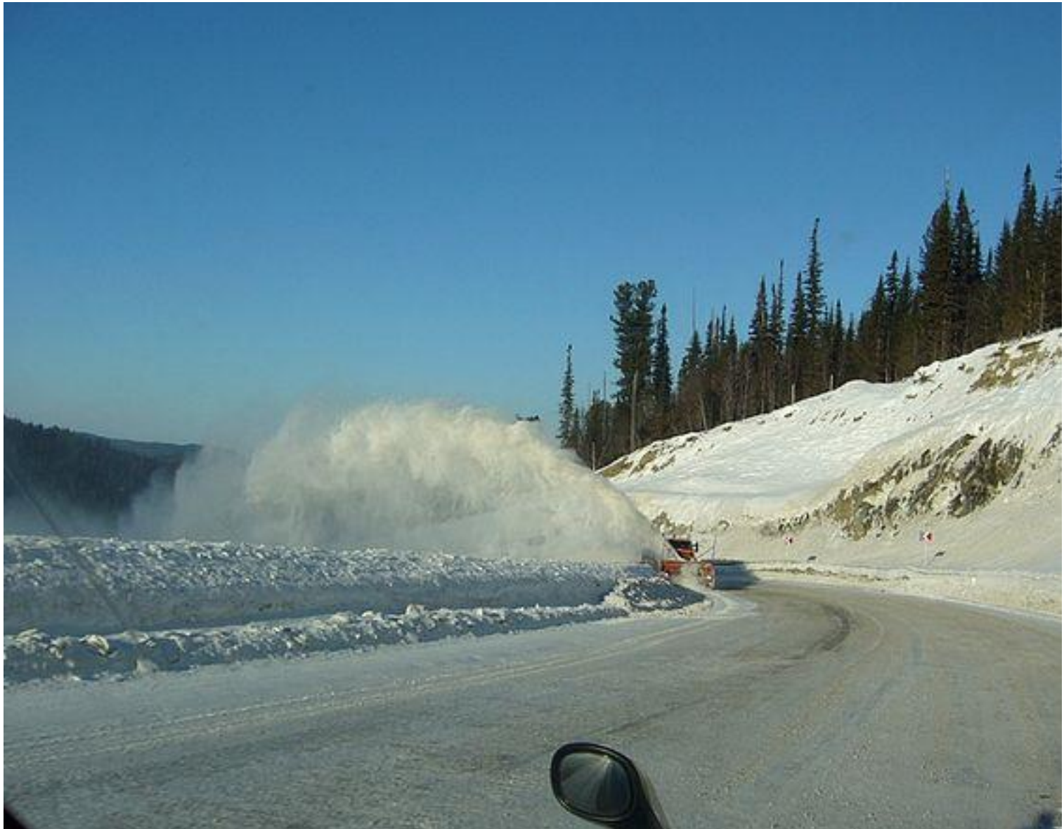
М-54 «Енисей». Буйбинский перевал