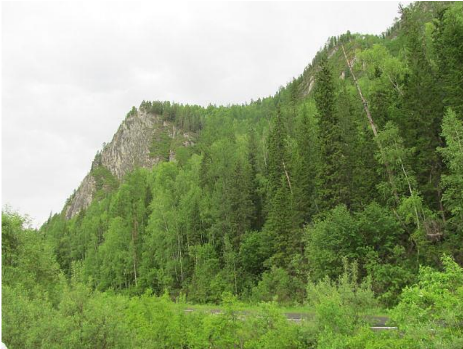
Абакан – Ак-Довурак летом