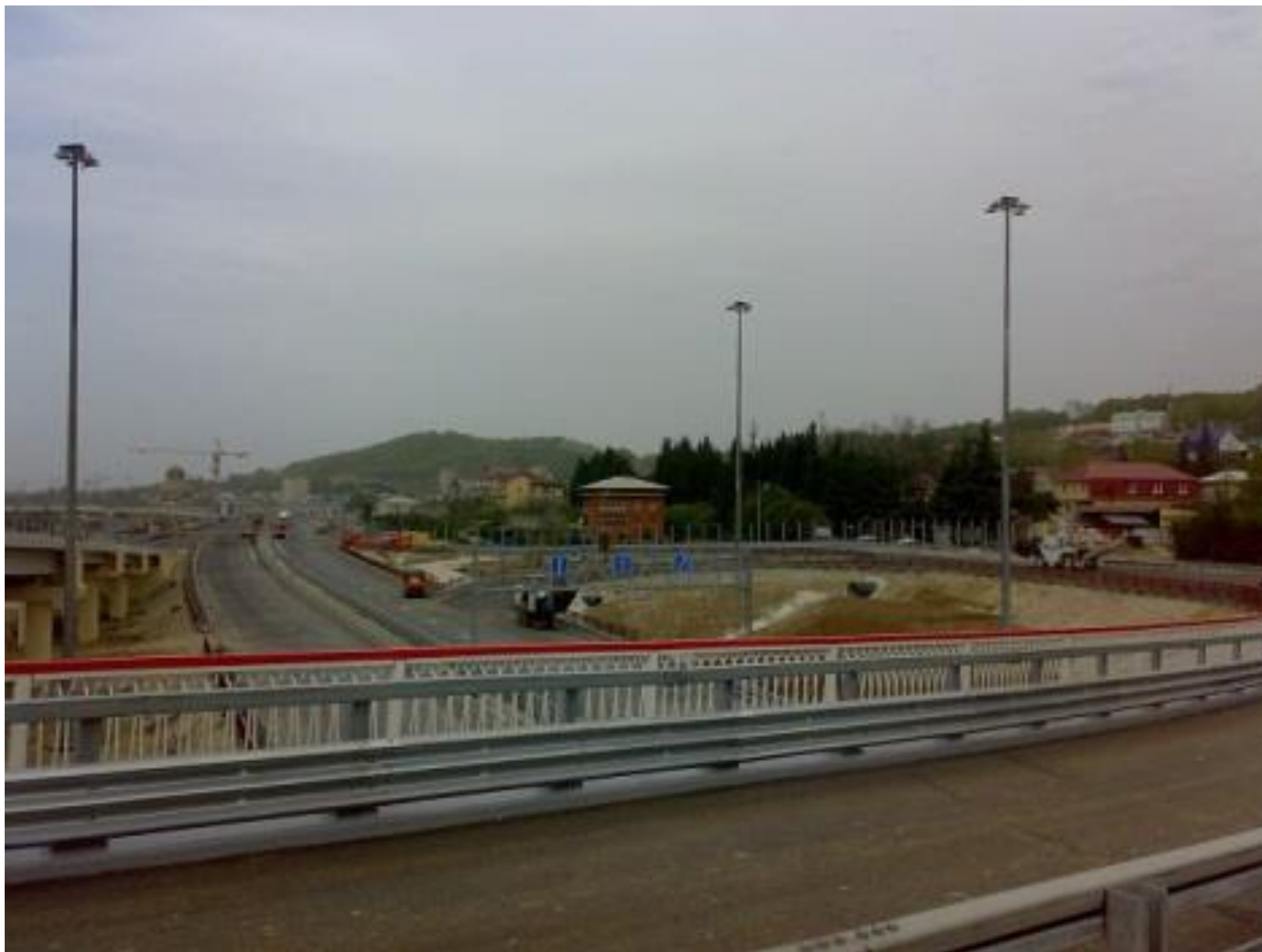
Сочи - Адлер