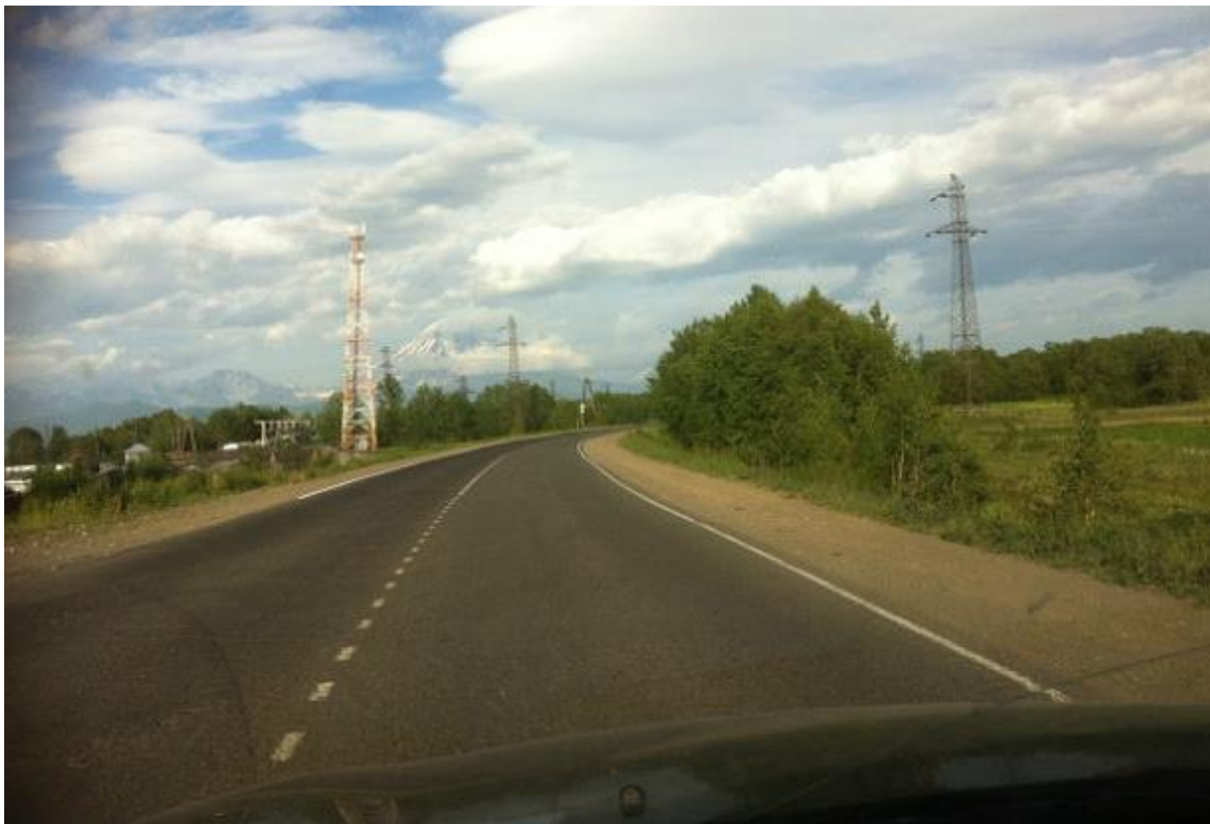
Дороги Камчатки. На горизонте вулканы