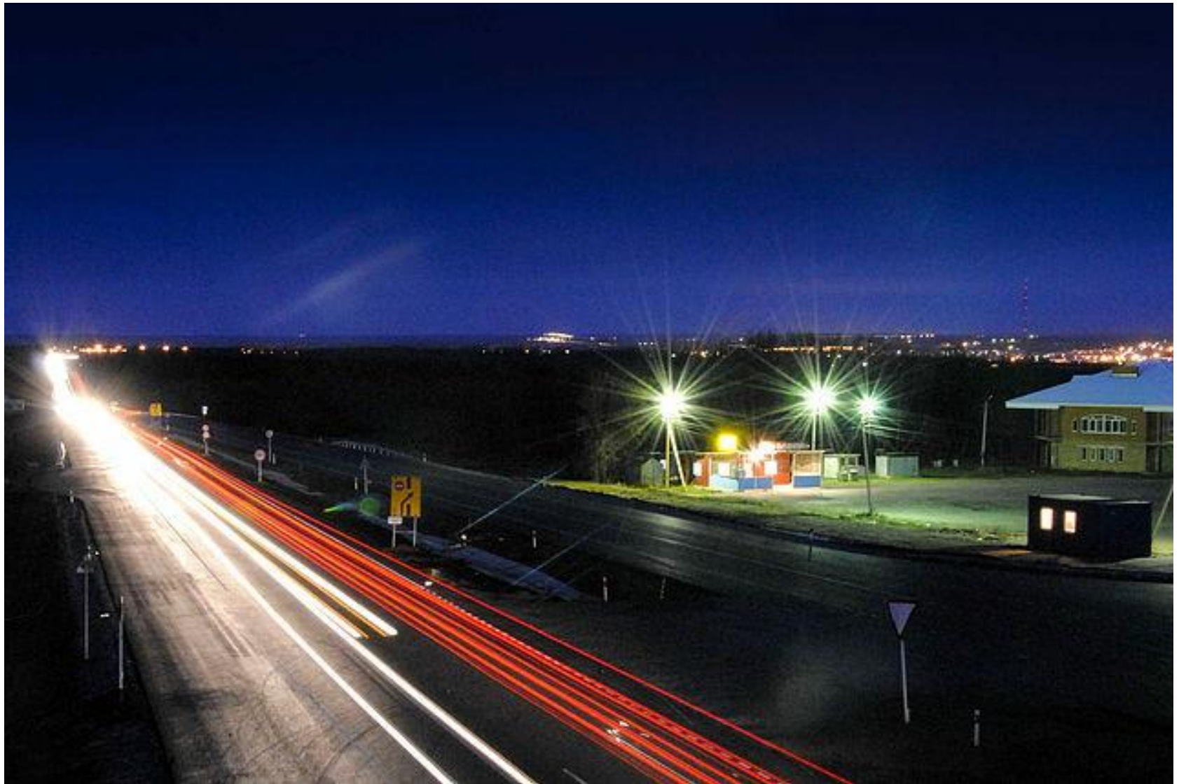
М-4 ДОН на фоне Каменска-Шахтинского. Во время реконструкции