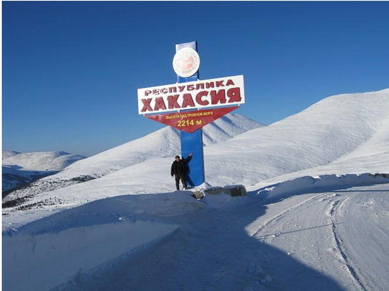
Автодорога Абакан-Ак-Довурак. Западно-Саянский перевал