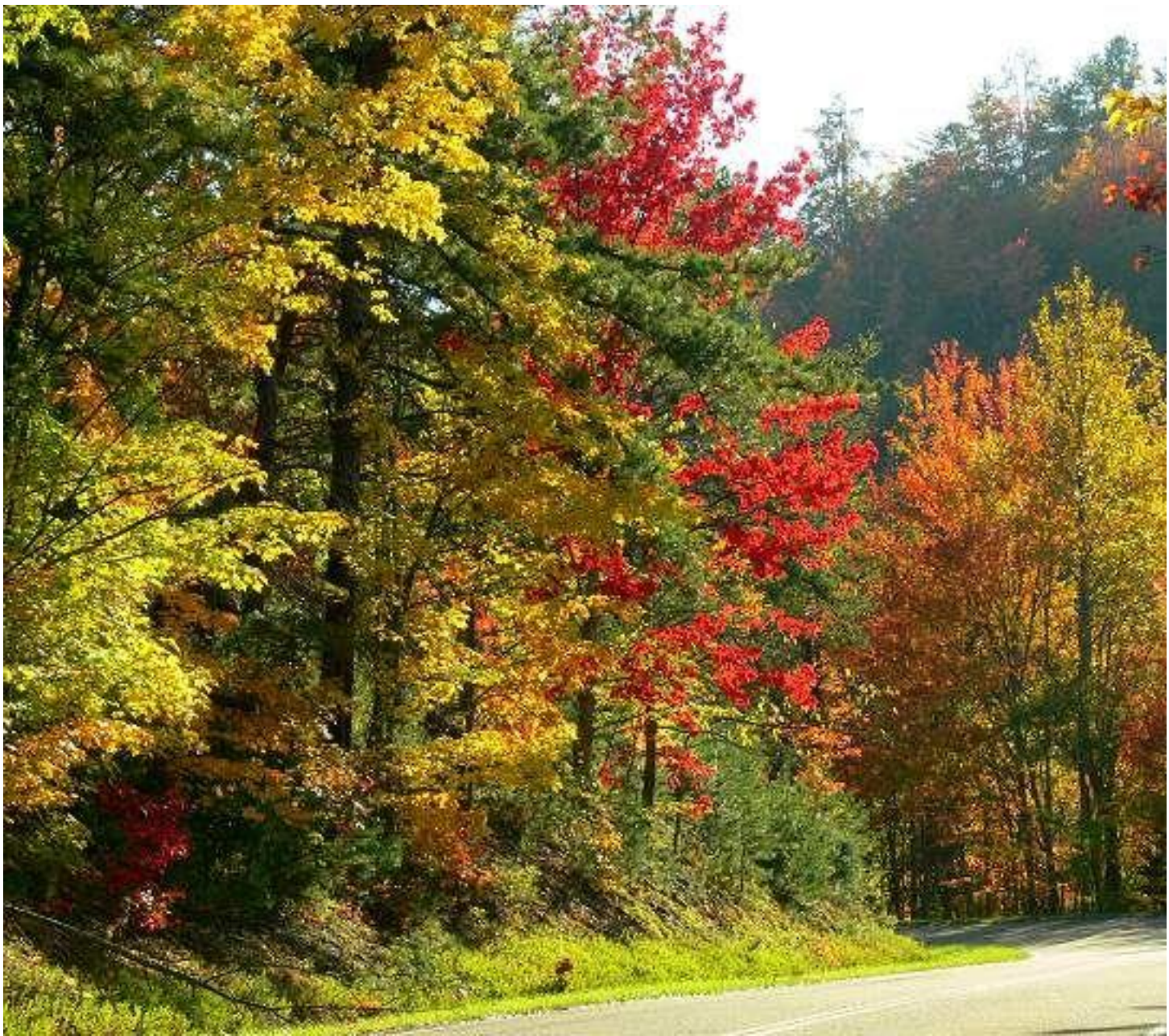
Лесная дорога. Владимирская область.