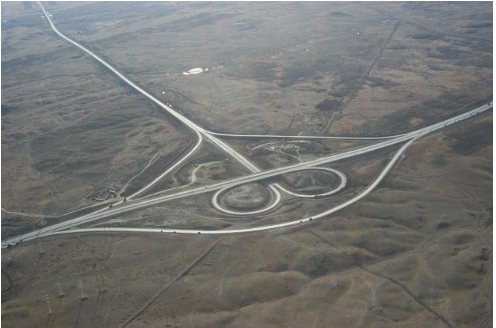
Обход г. Орска, 1-я очередь