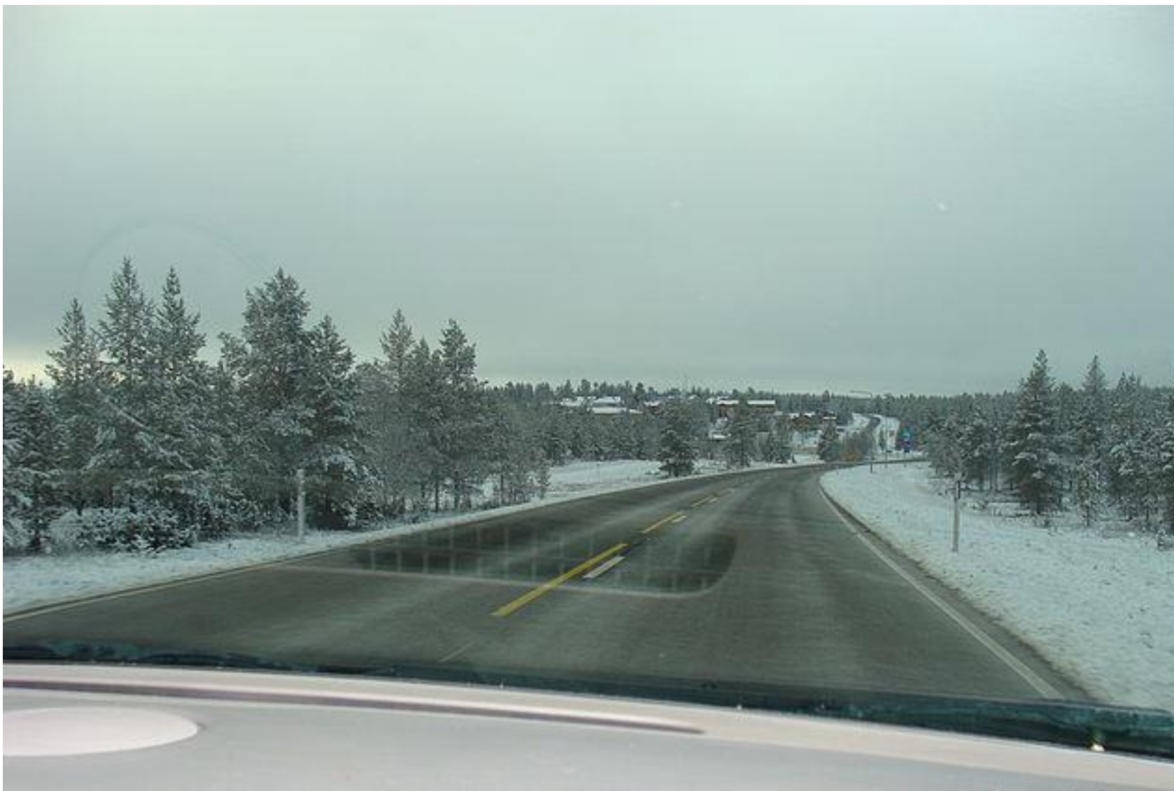
Норвегия на границе с Мурманской областью