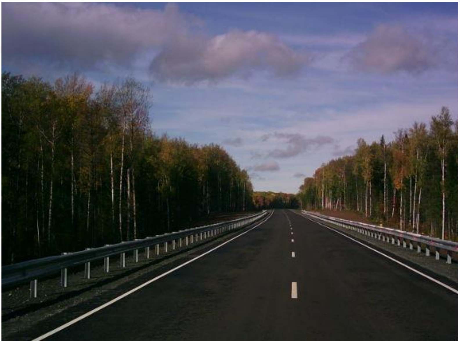
Ханты-Мансийск - Нягань