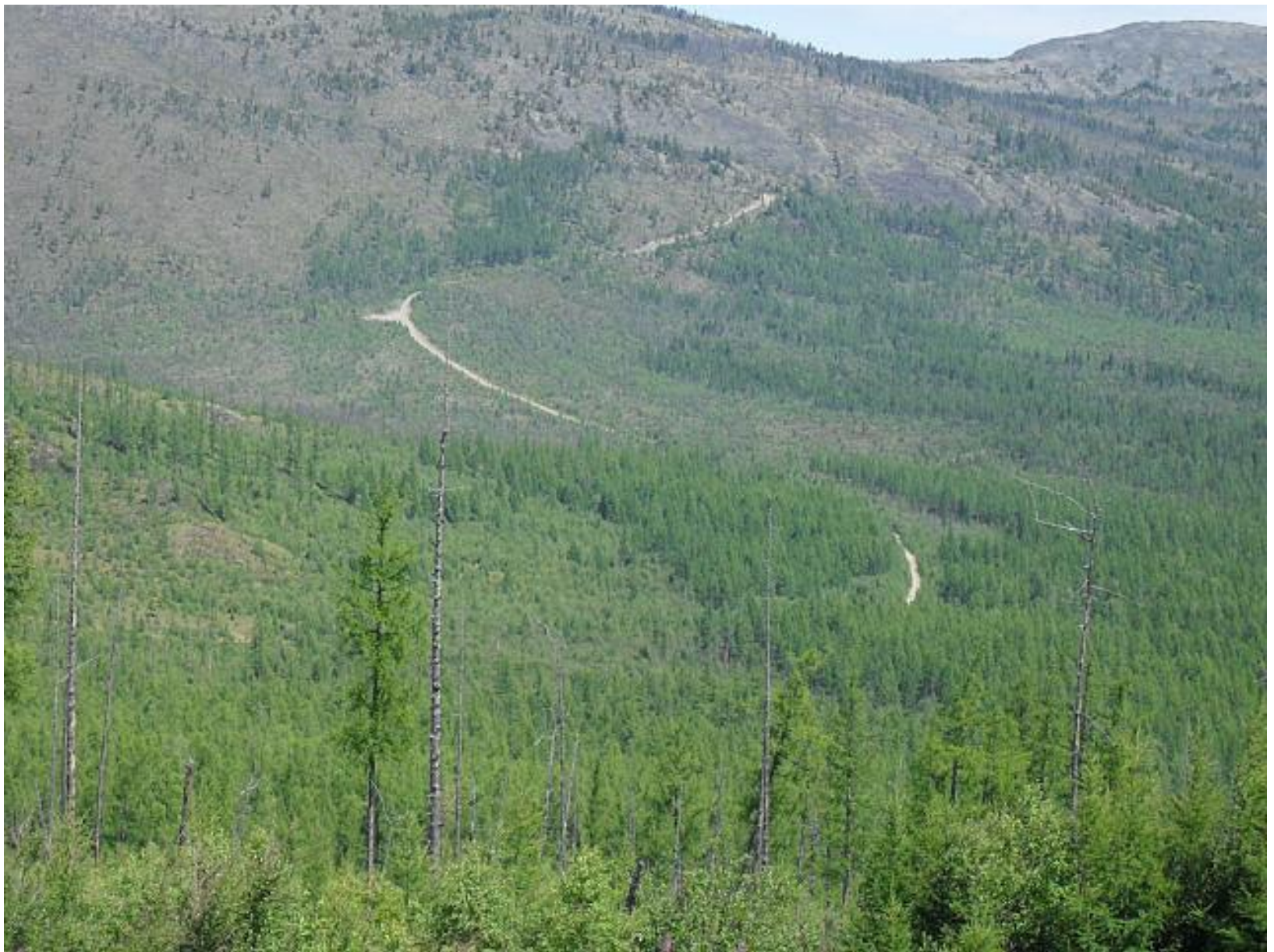
М-54 участок Арадан-Шивилиг