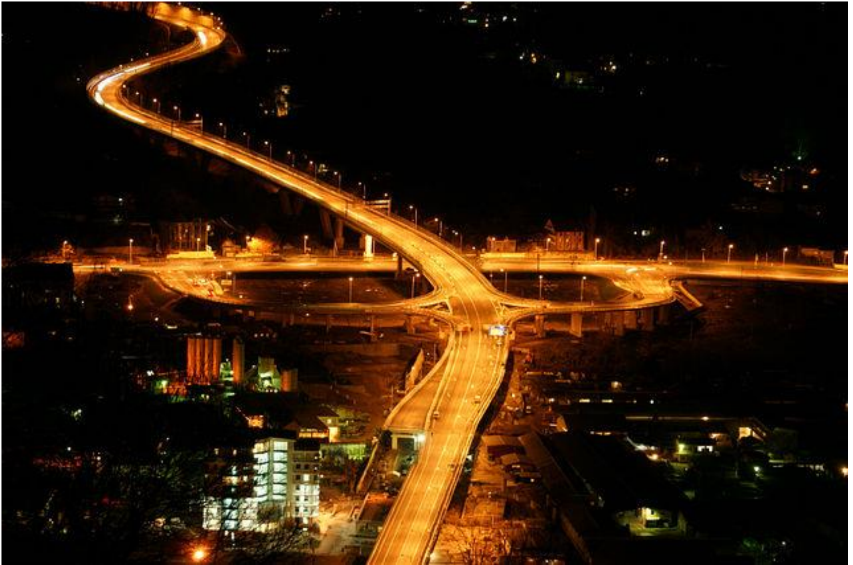
Джубга-Сочи (обход г. Сочи). Транспортная развязка ул. Пластунская