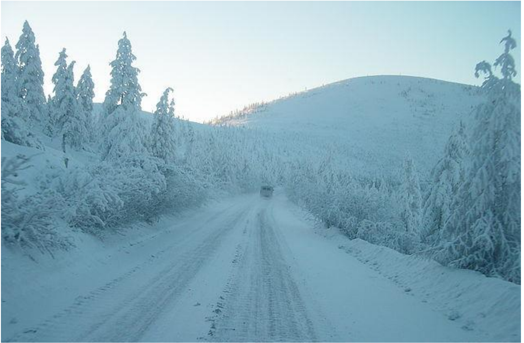
«Колыма» Якутск - Магадан