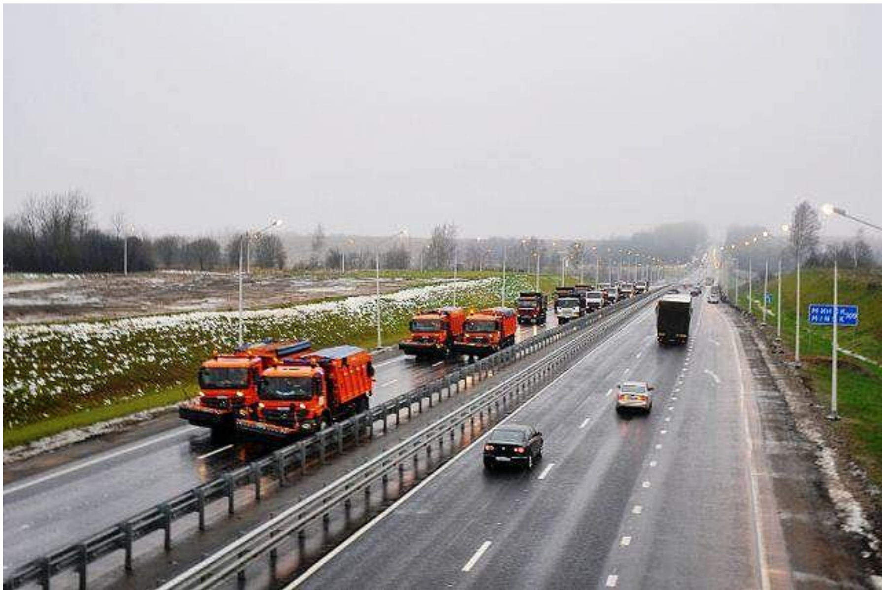
М-1, перегон техники на новый участок