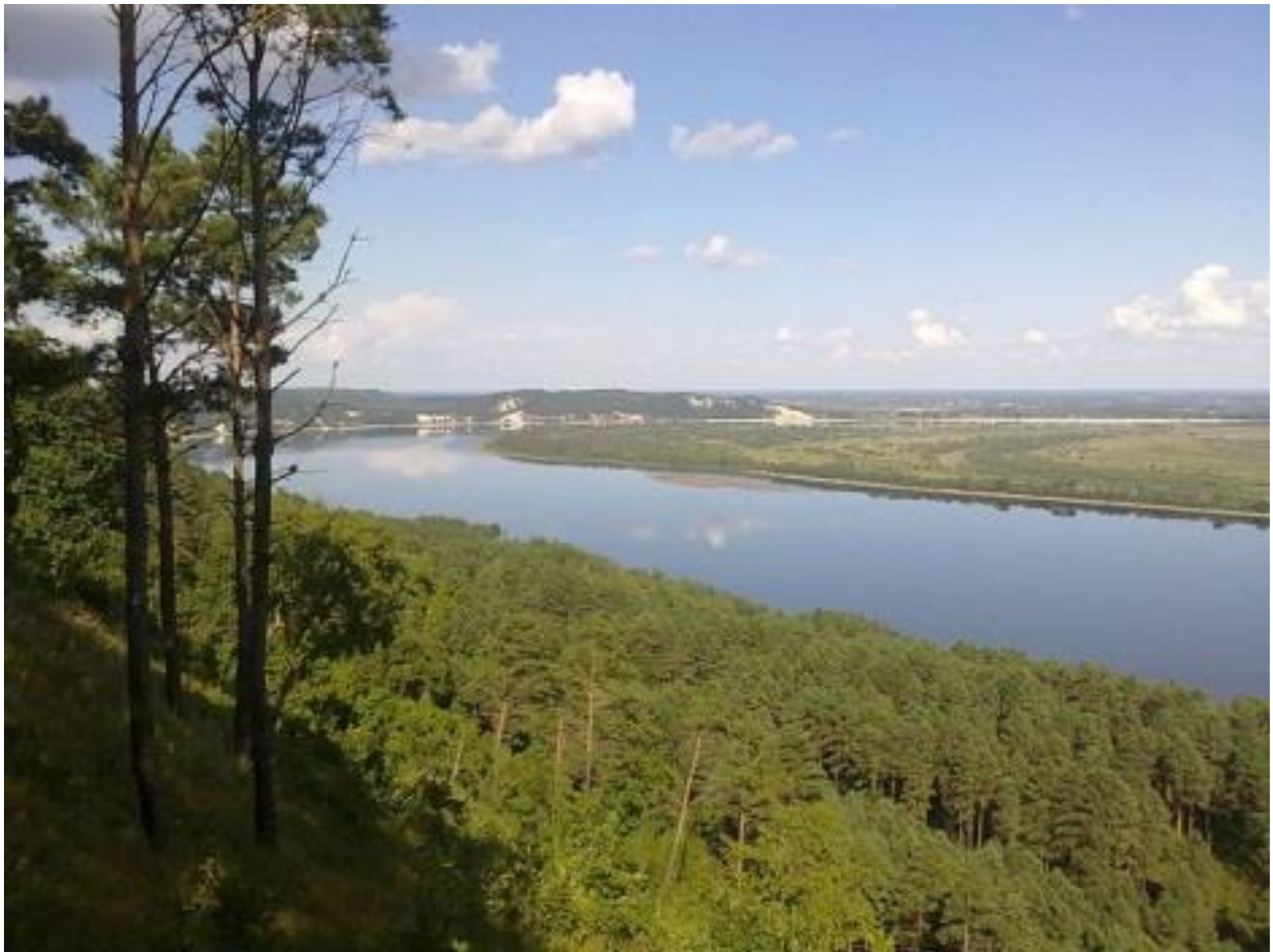
Излучина реки Зея, дорога Благовещенск - Свободный, Амурская область