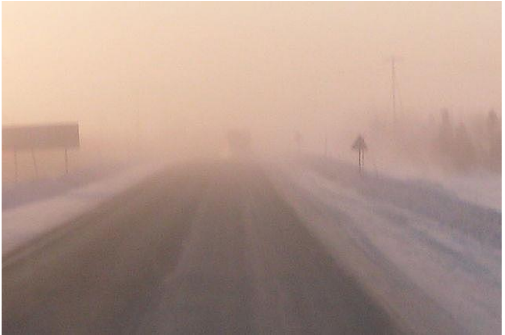
Нижневартовск – Радужный. Пурга