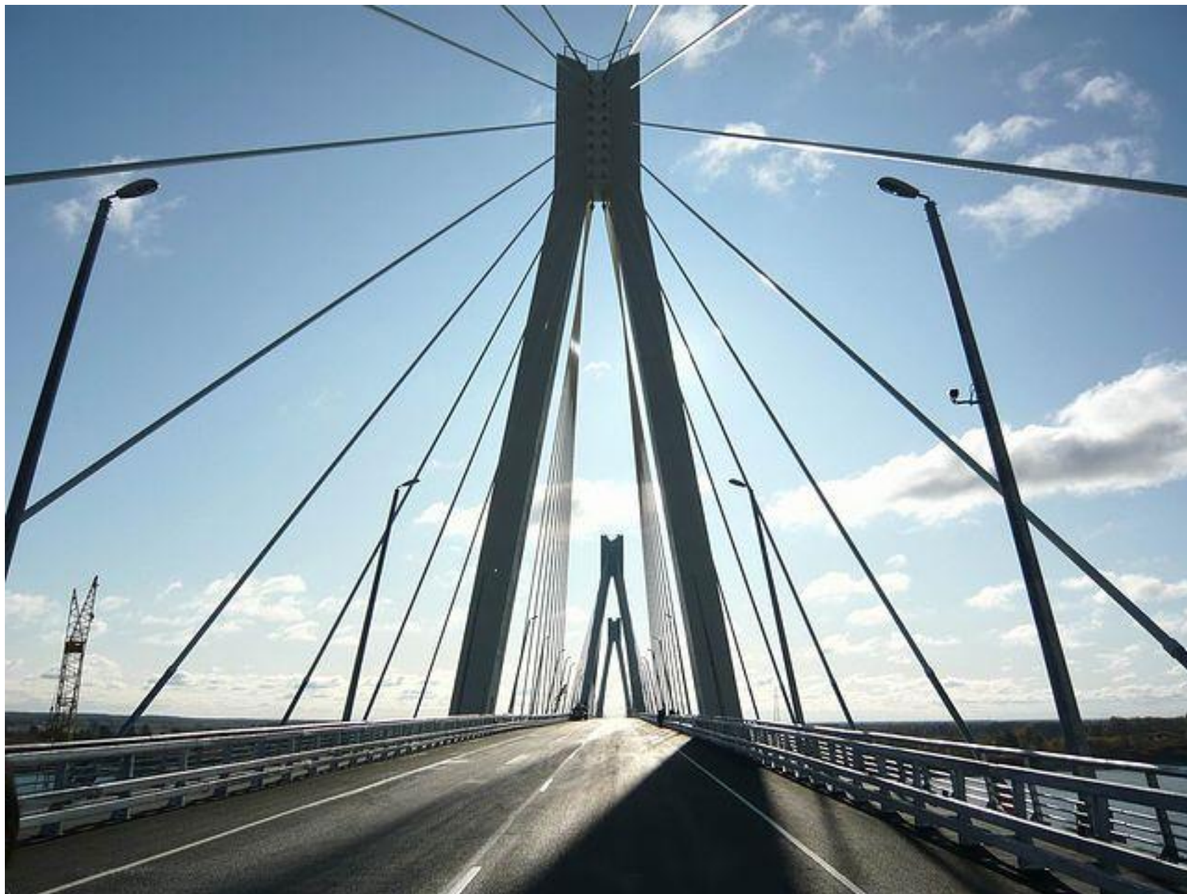
Обход г. Муром