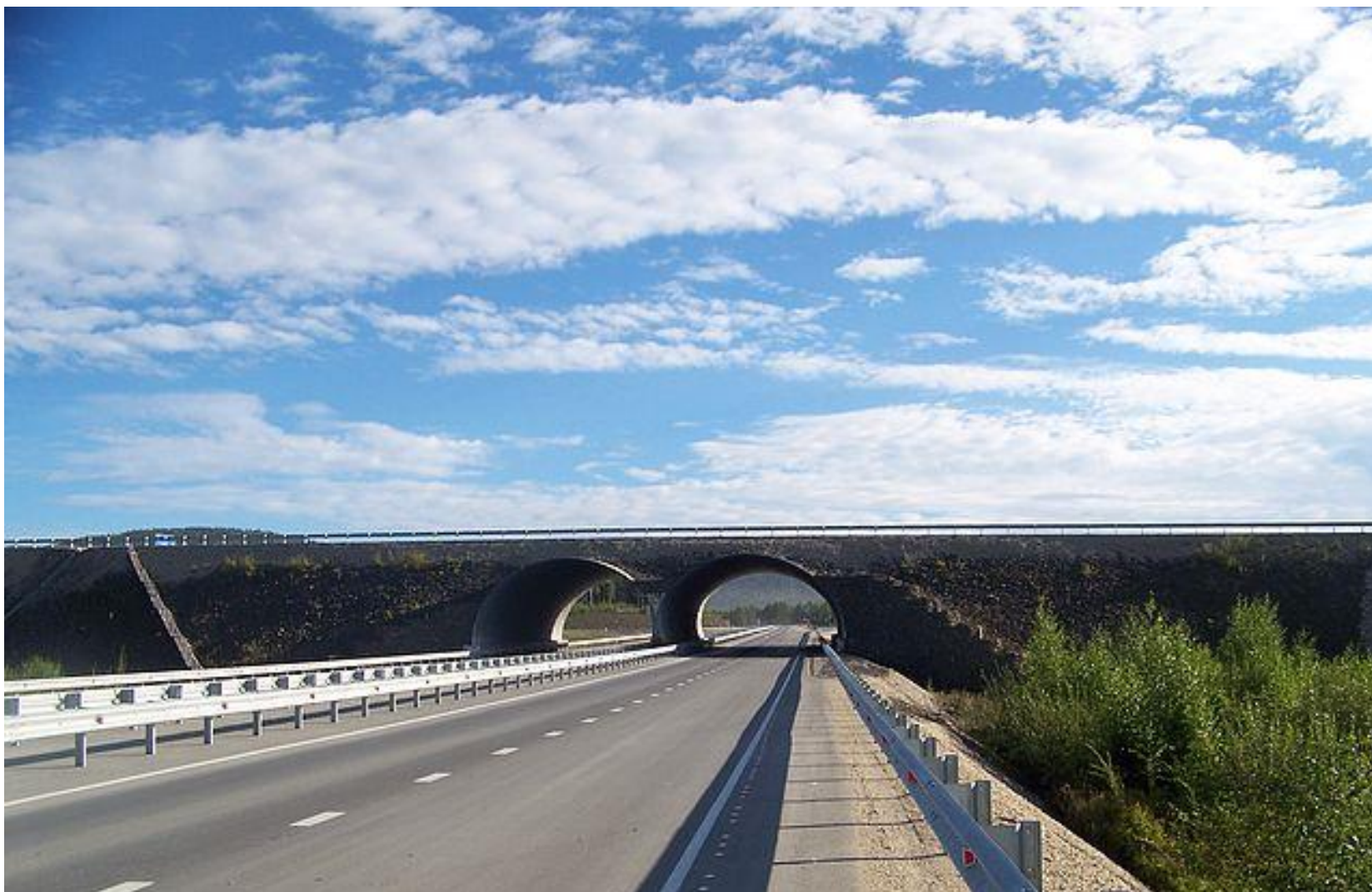
«Амур» лег на «Лену». Путепровод на пересечении двух федеральных дорог