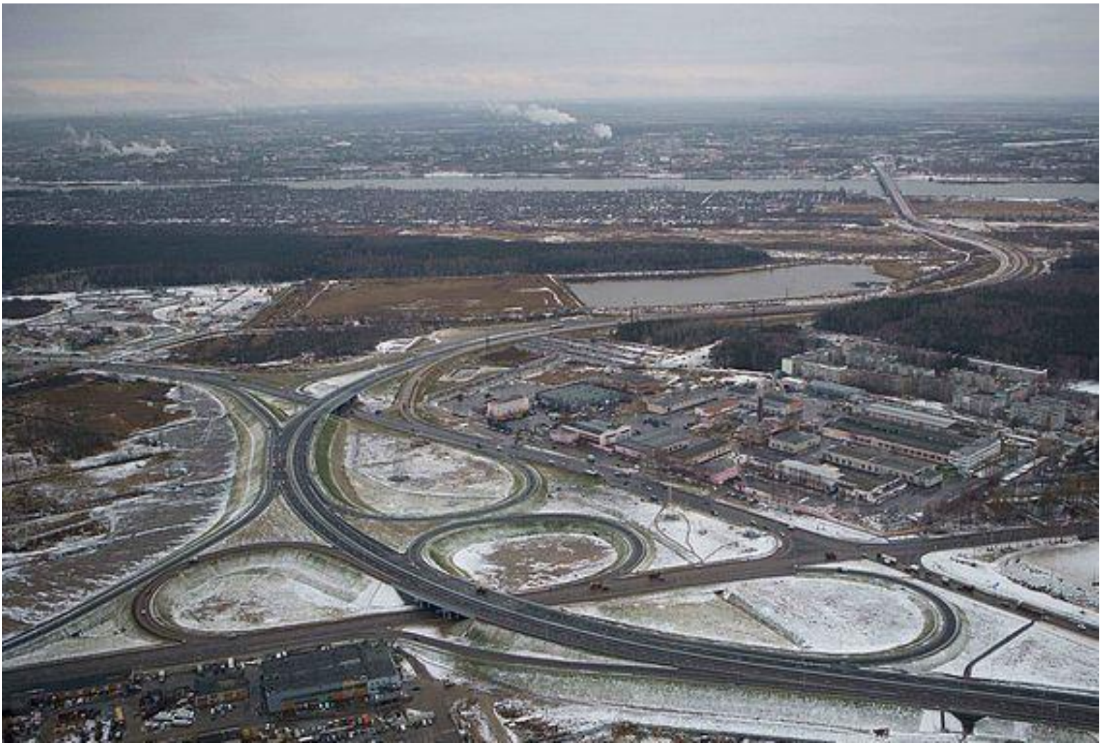
Развязка на км 273 М-8 «Холмогоры» в Ярославской области