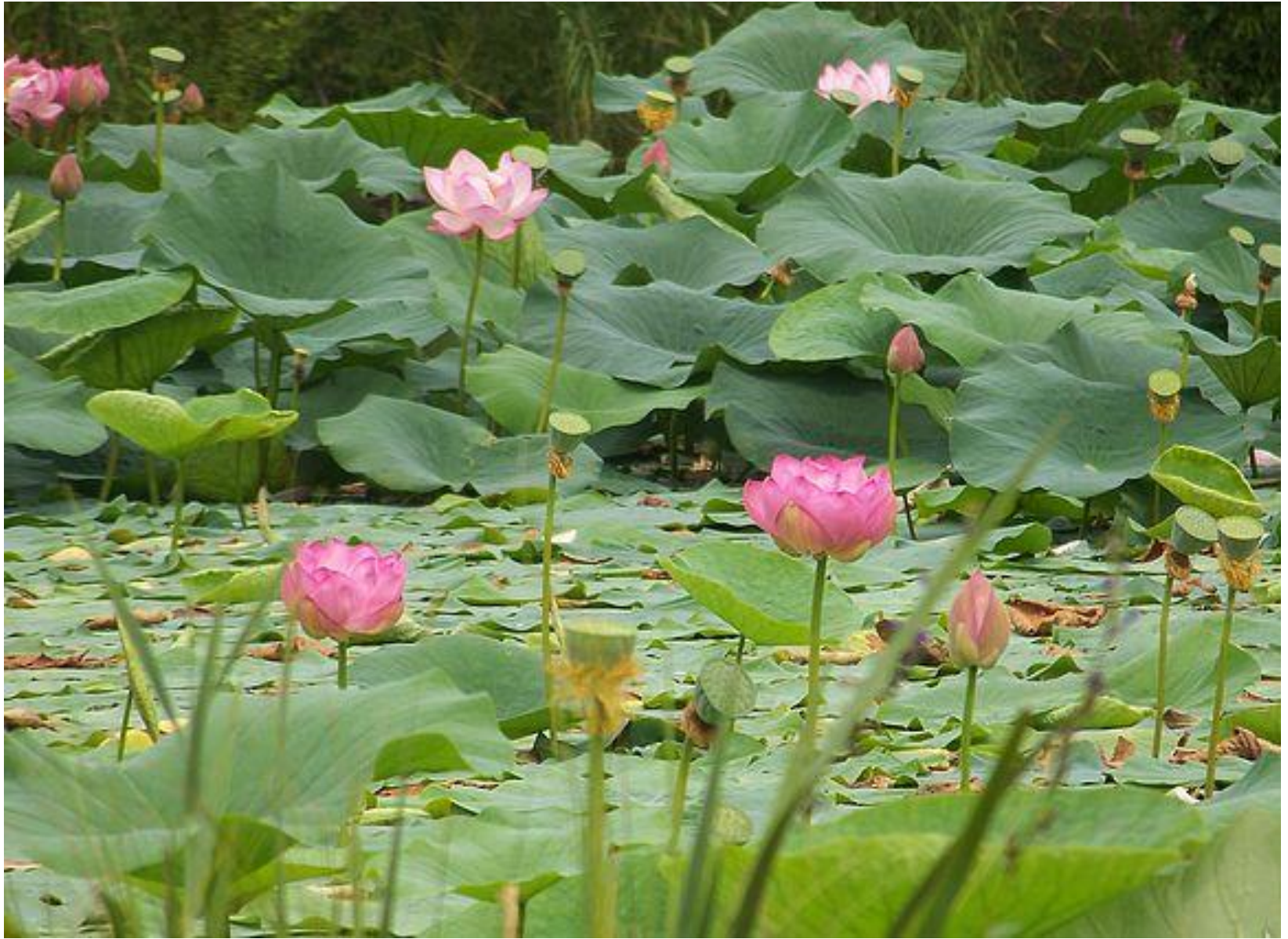
М-60 «Уссури». Хабаровск - Владивосток. Озеро лотосов у дороги