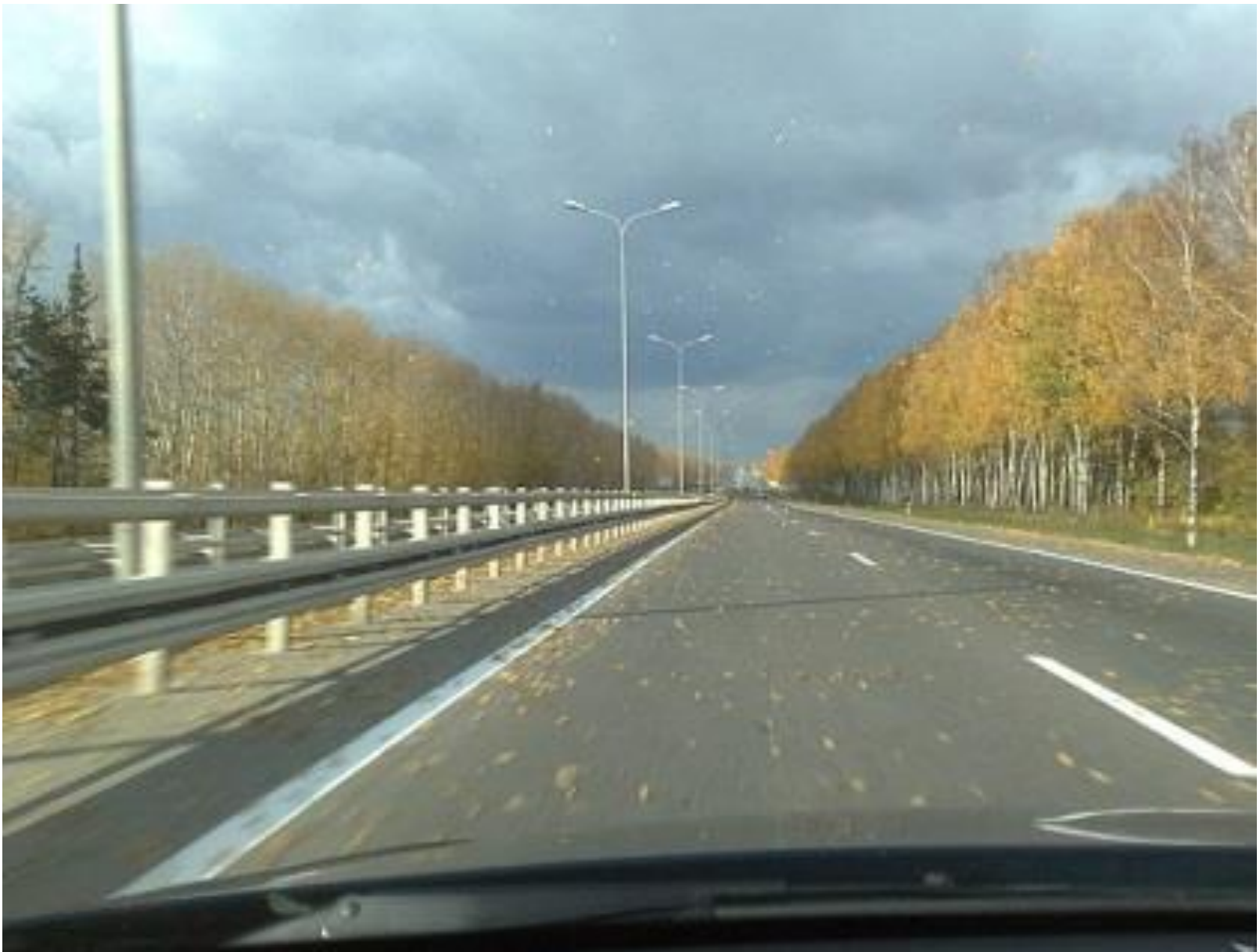
Осень, подъезд к Кемерово