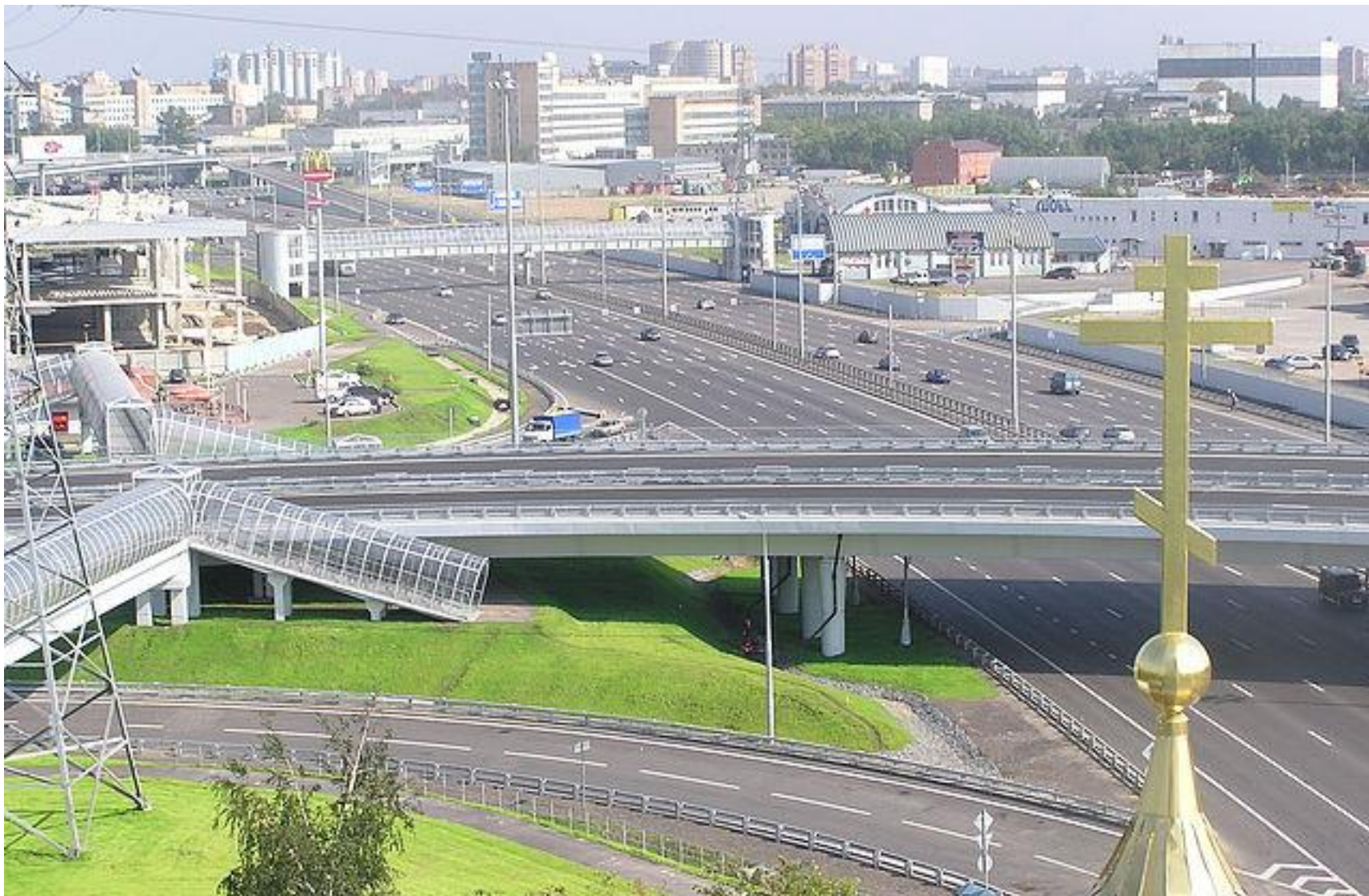
Москва. Ярославское шоссе. Мытищи-Королёв